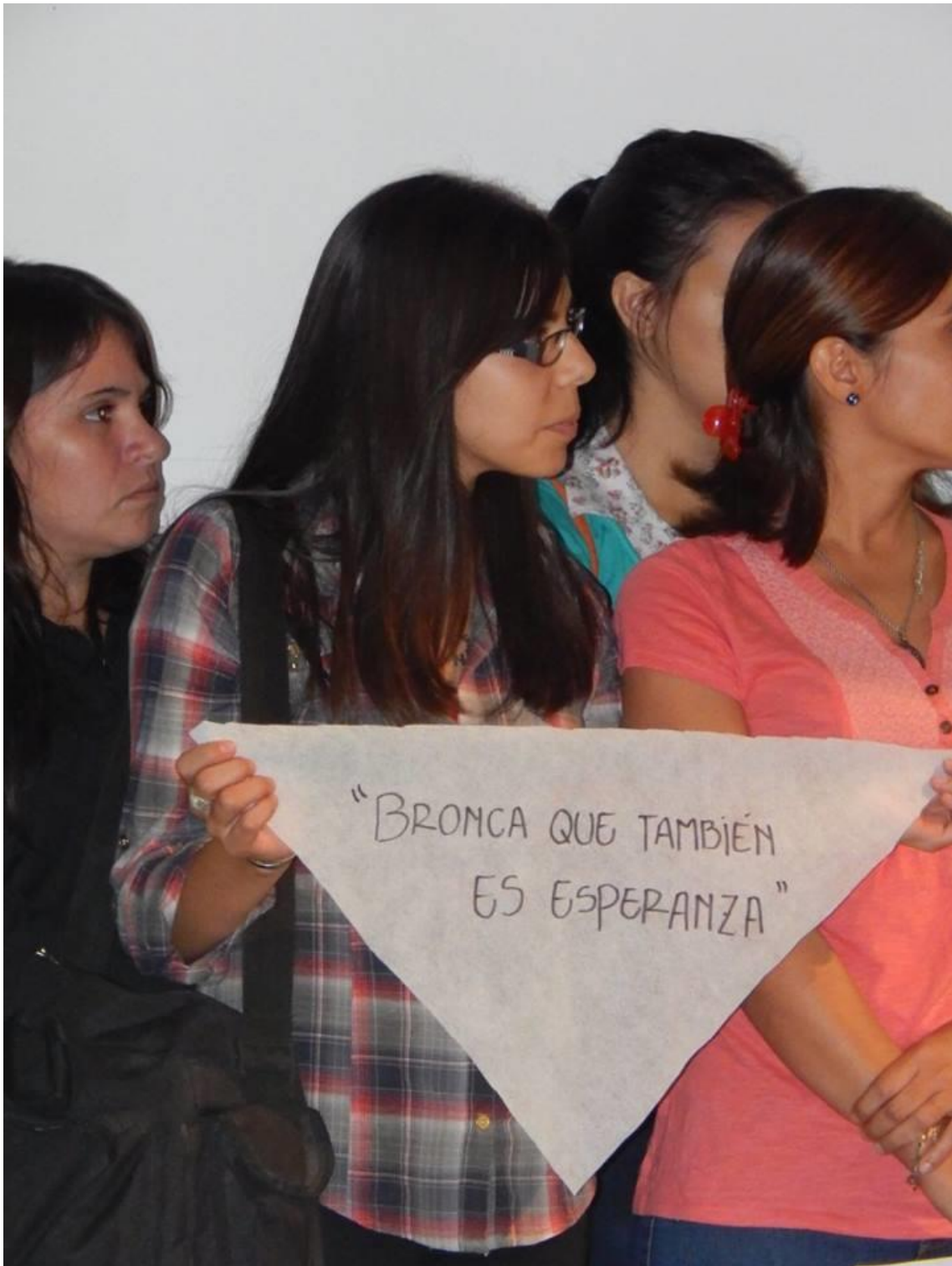
Exposición de Murales realizada en la Plaza 25 de Mayo. Estos murales corresponden a los talleres que los alumnos del Centro de Estudiantes realizaron con dos Escuelas Secundarias de la Localidad.