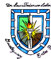
IES "Dr. Luis F. Leloir" Gualeguay- Entre Ríos